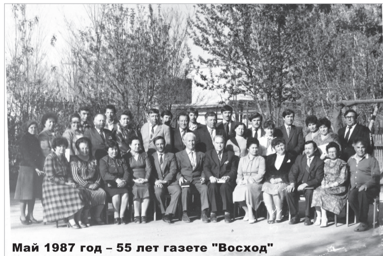
Май 1987 год – 55 лет газете «Восход»

В летописи Нефтекумского района много достойных исторических дат. Среди них – рождение нашей «районки», газеты «Восход», которая, являясь частью истории района, сама на протяжении многих лет пишет историю Нефтекумья, историю жизни своих земляков.