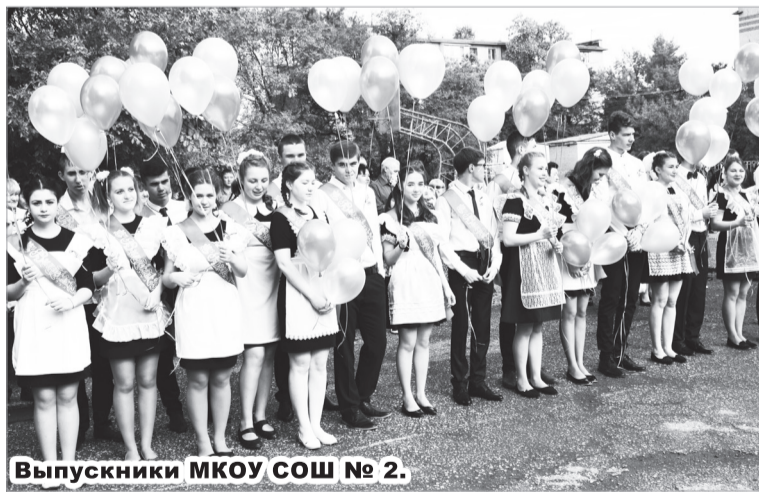
Выпускники МКОУ СОШ № 2.