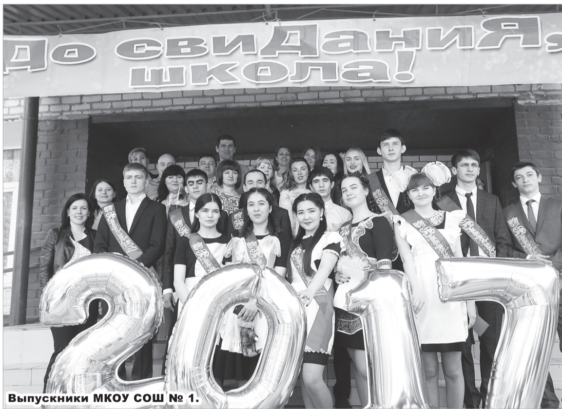
Выпускники МКОУ СОШ № 1.

Яркое солнышко, школы Нефтекумского района в праздничном убранстве, звуки веселой школьной музыки, девчонки с белыми бантами, ребята в галстуках и костюмах, море цветов, слезы родителей, учителей и самих ребят – это праздник Последнего школьного звонка, один из самых незабываемых событий в жизни выпускников.