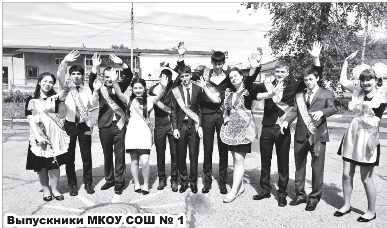
Выпускники МКОУ СОШ № 1

В Нефтекумском районе 12 июня 2017 года стали известны результаты ЕГЭ по математике базового уровня. Экзамен по данному предмету проводился 31 мая.