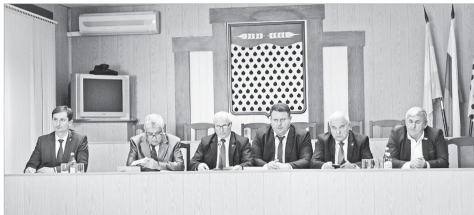
Выборы главы Нефтекумского городского округа состоялись 30 октября.

В соответствии с Порядком проведения конкурса по отбору кандидатур на должность главы Нефтекумского городского округа, утвержденному Решением Думы Нефтекумского городского округа первого созыва от 26 сентября 2017 года № 14, конкурс проводился в два этапа.