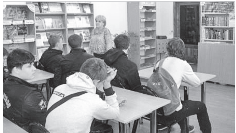
7 ноября отмечается 100-летие Великой Октябрьской революции.

Все дальше и дальше отдаляемся мы от этой исторической вехи. На протяжении всей советской эпохи день 7 ноября был «красным днем календаря», то есть государственным праздником. В 2005 году в связи с учреждением нового государственного праздника – Дня народного единства – 7 ноября перестало быть выходным днем.