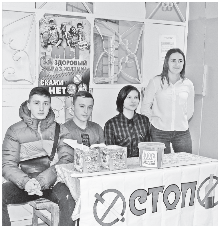
В ноябре в городе Нефтекумске прошла районная волонтерская акция «Меняем сигарету на конфету!», организаторами которой выступило муниципальное казенное учреждение «Молодежный центр» Нефтекумского муниципального района.

Акция проводилась в рамках Международного дня отказа от курения, в целях пропаганды здорового образа жизни и отказа от курения жителей района. Участие в акции приняли жители города и учащиеся Нефтекумского регионального политехнического колледжа. Специалисты и волонтеры доводили до сведения прохожих, как разрушительно влияет никотин на организм. А затем предлагали сделать шаг к здоровому образу жизни и обменять сигарету на конфету. Реакция прохожих была в основном доброжелательная, люди с удовольствием принимали участие в акции.