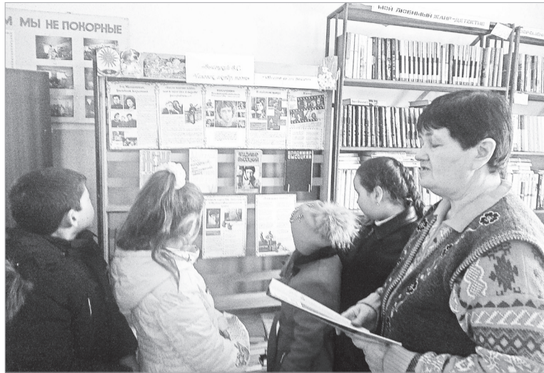
В сельской библиотеке поселка Зункарь 25 января прошел поэтический вечер, посвященный 80-летию В.С. Высоцкого.

Библиотекарь оформила выставку, посвященную жизни и творчеству, затем рассказала о самых важных вехах жизни поэта, актера, человека. Затем участники вечера читали любимые стихи Владимира Высоцкого, участвовали в турнире знатоков творчества поэта, который прошел в виде экзамена – отвечали на билеты в четырех номинациях-раундах: «Страницы биографии», «Театральная деятельность», «Кинематограф», «Песенное творчество». Во время турнира в записи слушали песни, исполняемые автором и известными российскими исполнителями.