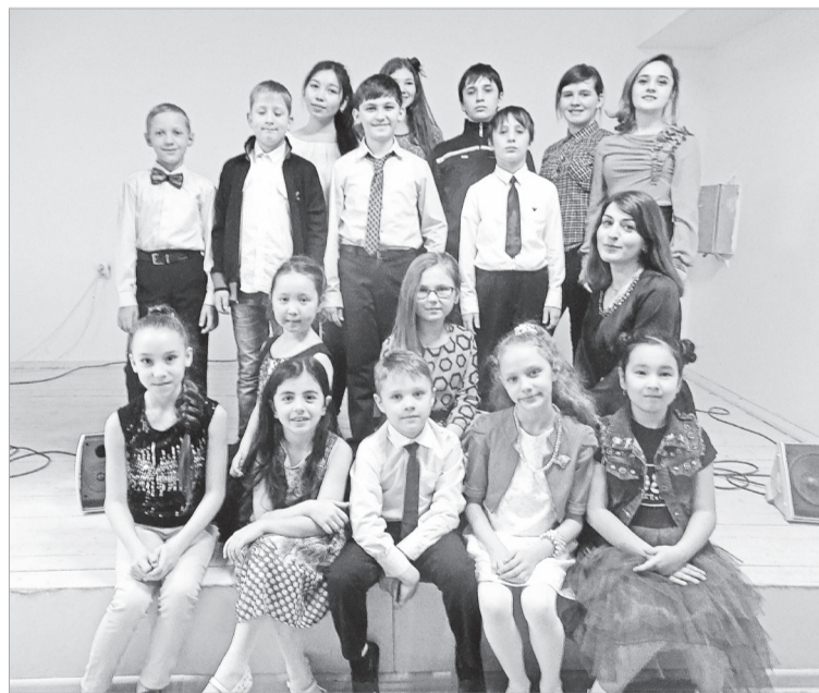
Народному кумиру, любимому поэту, актёру и певцу, Владимиру Семёновичу Высоцкому, 25 января должно было бы исполниться 80 лет.