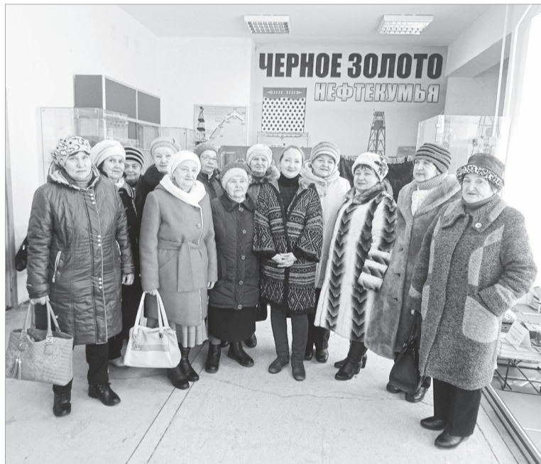
Музей является средоточием памяти места, села, города, страны, континента. Он становится формулой понятия родины для своих и набором отличительных особенностей места или народа в глазах других. Он же представляет подлинные вещи, которые рассказывают нам о истории.

В рамках академии третьего возраста получатели социальных услуг отделения дневного пребывания №1 г. Нефтекумска ежемесячно посещают Нефтекумский районный историко-краеведческий музей.