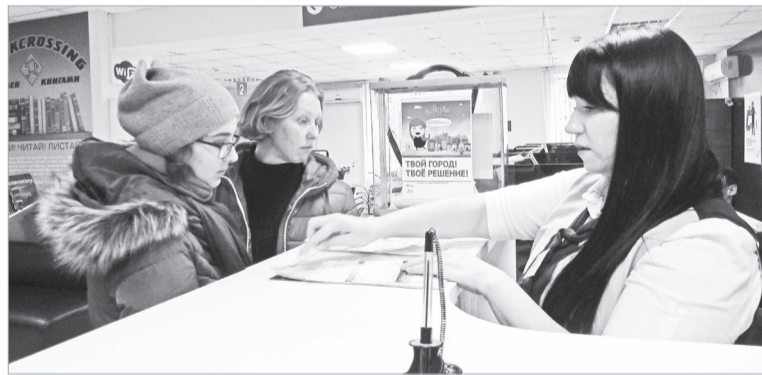
Жители и гости города Нефтекумск продолжают выбирать территорию для благоустройства в 2018 году.

Напоминаем, что с 9 января по 9 февраля проводится прием предложений о включении территорий города в рамках реализации муниципальной программы Нефтекумского городского округа «Формирование комфортной городской среды». Предложения принимаются в здании администрации г. Нефтекумск, во Дворце культуры «Нефтяник», Многофункциональном центре, а также в с. Ачикулак и п. Затеречный.