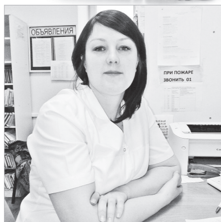
Моя мама – медицинский регистратор