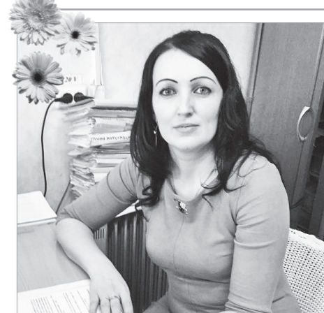
Моя мама – экономист

Экономист – профессия современности, несмотря на то, что слово «экономика» было придумано в Древней Греции. На сегодняшний день эта профессия относится в наиболее востребованным и перспективным профессиям в мире. Экономисты нужны везде: в учреждении, на производстве, в компании. Экономисты являются одним из самых значимых специалистов. Ежегодно сотни выпускников решают связать свою профессиональную деятельность с экономикой.