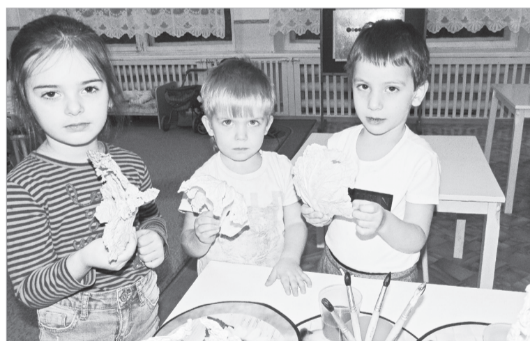
Детство – это пора поисков и ответов на самые разные вопросы. Исследовательская, поисковая активность – естественное состояние ребенка.

Дети замечают всё: сезонные изменения в природе, яркость красок, многообразие звуков, запахов. Они открывают для себя новый мир: стараются всё потрогать руками, рассмотреть, понюхать, если возможно, попробовать на вкус. Овладение способами практического взаимодействия с окружающей средой обеспечивает становление мировидения ребёнка, его личностный рост. Экспериментирование предоставляет ребёнку возможность самому найти ответы на вопросы «Как?» и «Почему?».