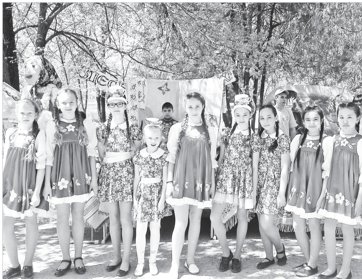
Косплей – это сравнительно молодой вид субкультуры, родившийся в Японии. Слово «косплей» на японском языке – косупурэ, сокращенное от английского словосочетания costume play, что переводится как «костюмированная игра».

Есть и мнение, что термин «косплей» придумал японский аниматор из студии Studio Hard Нову Такахашу. Во время посещения проходившего в 1984 году в США научно-фантастического фестиваля Worldcon, Такахашу был настолько поражен костюмированными представлениями и богатой экспозицией, что