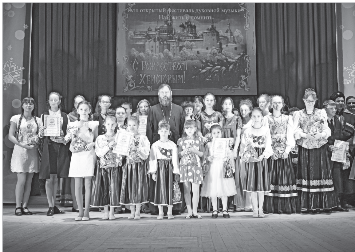
Светлый праздник – VIII фестиваль духовной музыки «Рождественские встречи» состоялся на святочной неделе во Дворце культуры «Нефтяник».

В зале звучала музыка живая, как река и открытая только добрым людям. Исполняли духовные произведения учащиеся детских музыкальных школ. Домов культуры, сольные исполнители и ансамбли.